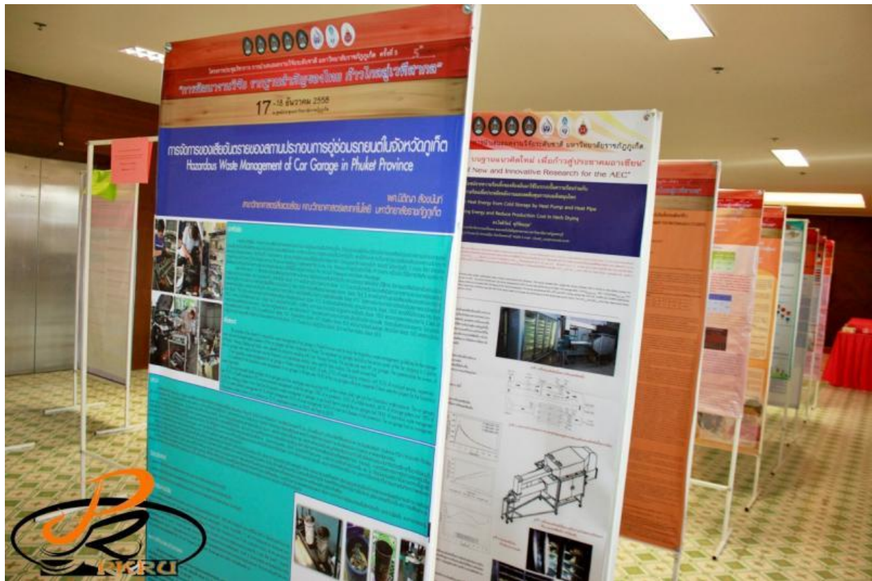
ตัวอย่างขาตั้งโปสเตอร์